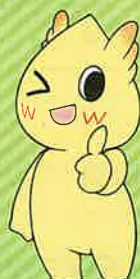
本校マスコットキャラクター ウェッビー