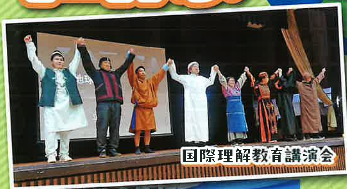
国際理解教育講演会