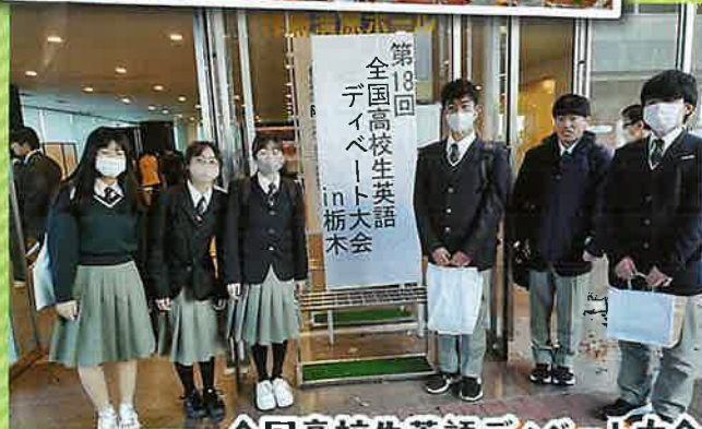
全国高校生英語ディベート大会