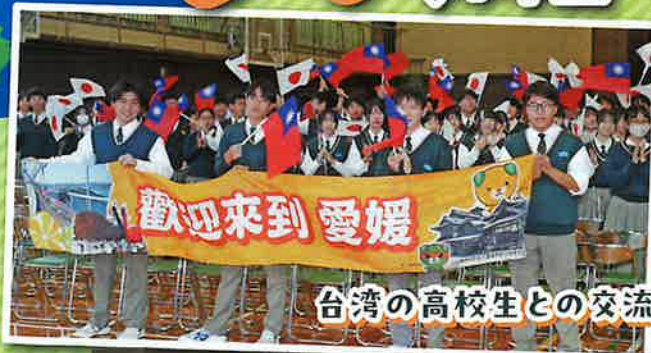
台湾の高校生との交流活動