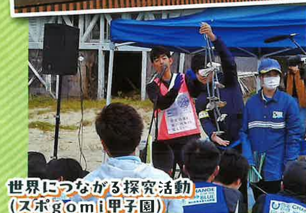
世界につながる探究活動 (スポgomi甲子園)