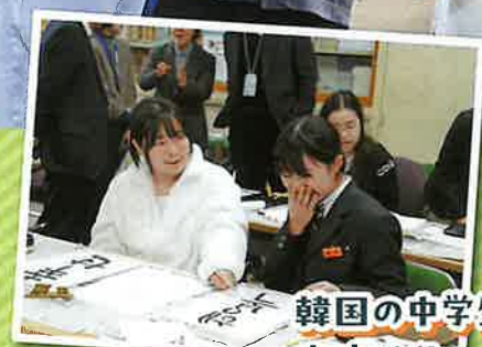
韓国の中学生との 交流活動