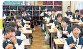
楽しい給食の時間

授業は… 1時間50分、1日6時間 完全下校は… 3月～10月は 18:00 11月～2月は 17:30