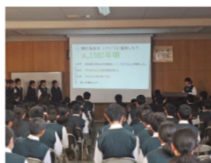
総合的な学習の時間 発表会