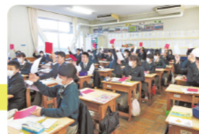
活気あふれる午後の授業