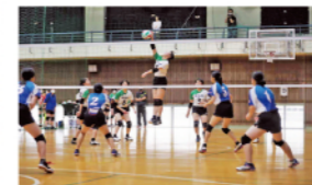
バレーボール女子