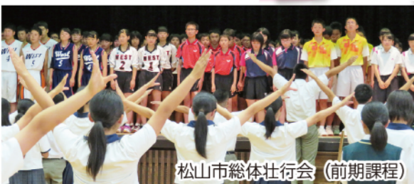
松山市総体壮行会 (前期課程)