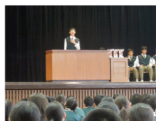
校内レシテーションコンテスト (英語スピーチコンテスト)