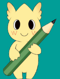
マスコットキャラクター ウェッピー