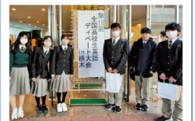
第18回全国高校生英語ディベート大会 in 栃木出場