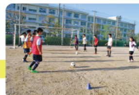
放課後の部活動では、後期課程（高校生）の先輩も指導してくれます。

授業は… 1時間50分、1日6時間 完全下校は… 3月～10月は 18:00 11月～2月は 17:30