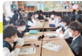
意見を出し合う午前中の授業