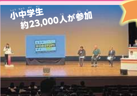
小中学生 約23,000人が参加